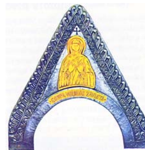
Gospa Velikog hrvatskog zavjeta

Natječaj traje do 15. rujka. Službeni upitnik možete dobiti na www.hss-canada.ca