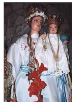
Majka Božja od Krasna