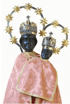
Majka Božja Bistrička