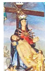
Majka Božja žalosna, Mrkopalj