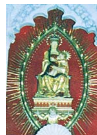
Milosna Gospa, Šijana, Istra